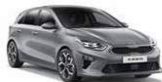
Lunar Silver (CSS)