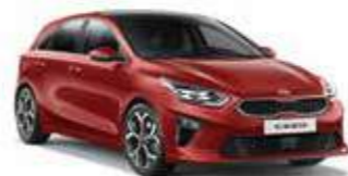
Infra Red (AA9)