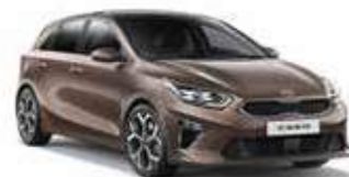
Copper Stone (L2B)