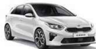
Deluxe White (HW2)