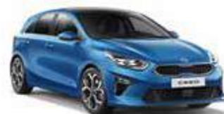
Blue Flame (B3L)