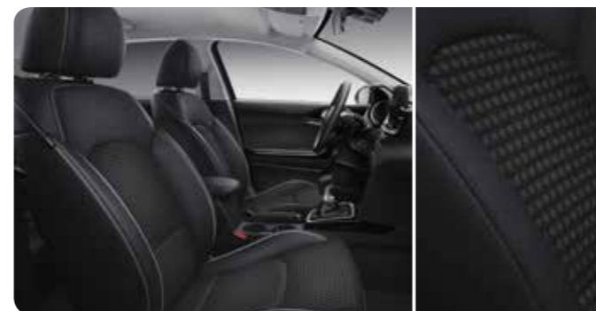
Zwarte halflederen / halfstoffen zetelbekleding