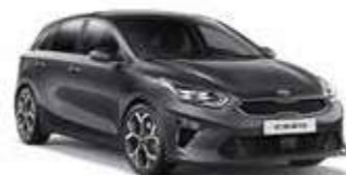
Dark Penta Metal (H8G)