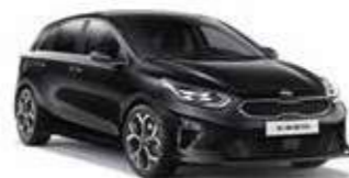
Black Pearl (1K)