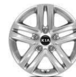
16" aluminium velgen met 205/55 banden