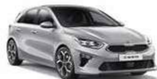
Sparkling Silver (KCS)