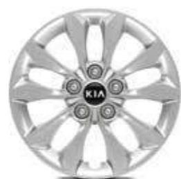
16" Stalen velgen 205/55 banden en wieldeksels