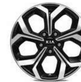
17" aluminium velgen met 225/45 banden (optioneel)