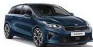
Cosmo Blue (CB7)