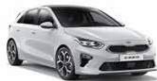
Cassa White (WD)**