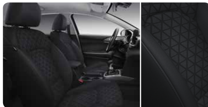
Zwarte stoffen zetelbekleding